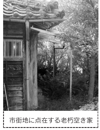
市街地に点在する老朽空き家

企業誘致推進事業費(新) (うち企業誘致活動分) ……2,867万6千円 将来の本市経済を支える核となる企業の積極的な誘致活動を展開するため、(財)長崎県産業振興財団への職員派遣や、東京等への企業誘致協力員の配置などを行う。