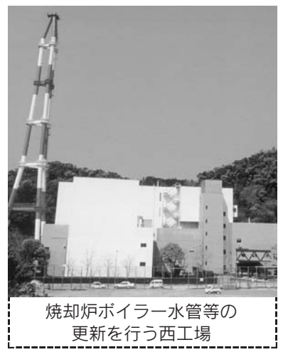
焼却炉ボイラー水管等の更新を行う西工場

子育て支援センター施設整備事業費(新) ……1,400万円 子育て支援センターの設置にあたり、施設や機器等の整備を行う。 東工場施設整備事業費 ……2億円 施設の老朽化に伴い消耗が激しい機器について、整備更新を行う。 事業期間…平成18年度