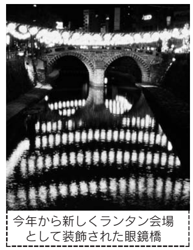
今年から新しくランタン会場として装飾された眼鏡橋

長崎ランタンフェスティバル事業共催費負担金 ……7,000万円 開催期間…平成19年2月18日～3月4日 開催場所…湊公園、中央公園、新地中華街、中島川公園ほか