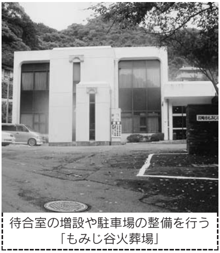
待合室の増設や駐車場の整備を行う「もみじ谷火葬場」

企業誘致推進事業費(新) (うち企業誘致活動分) ……2,867万6千円 将来の本市経済を支える核となる企業の積極的な誘致活動を展開するため、(財)長崎県産業振興財団への職員派遣や、東京等への企業誘致協力員の配置などを行う。